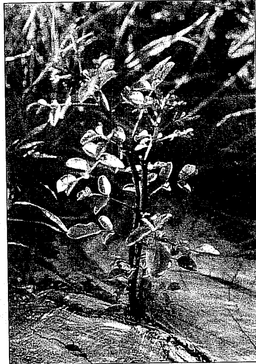
Abb. 4: Robinienstockausschlag

Grenzen ihres natürlichen Areals oder bei der Besiedelung von Grenzstandorten, in den Vordergrund. Dies ermöglicht ihnen ein Beharren und Ausbreiten am jeweiligen Standort. Es erschwert aber eine mechanische Kontrolle, da sie auf Abschneiden und Verletzungen mit Ersatztriebbildungen und verstärktem klonalem Wachstum reagieren. Dank der Symbiose mit Rhizobium-Bakterien besitzt die Robinie zudem die Fähigkeit, Luftstickstoff zu binden. Dies ermöglicht ihr auf armen Böden rasches Wachstum, führt aber auch zu unerwünschten Vegetationsveränderungen (z. B. auf Magerrasen) (KOWARIK 2003). Bestimmte Eigenschaften, wie eine lange Lebensdauer von Samen im Boden oder vegetatives Regenerationsvermögen, komplizieren eine gezielte Steuerung der Bestände und schränken Bekämpfungsmöglichkeiten und -erfolge ein. Hier ist eine Bewertung des jeweiligen Einzelfalls sinnvoll. Können waldbauliche Maßnahmen, z. B.