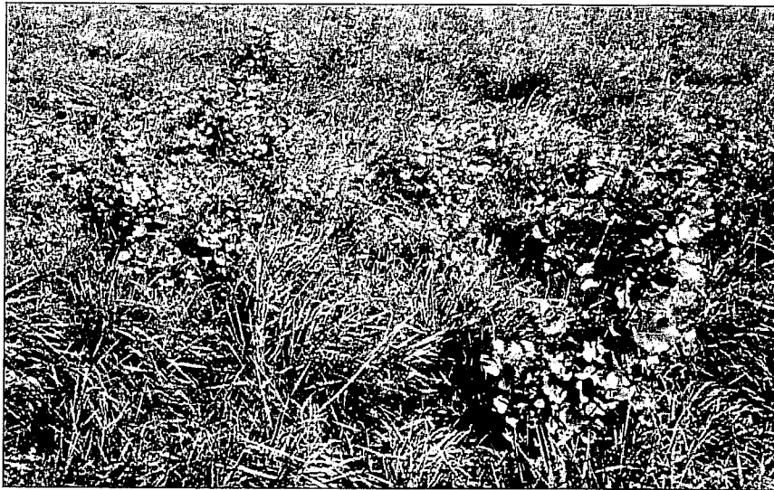
Abb. 1: Frische Wurzelbrut von Pappelhybriden